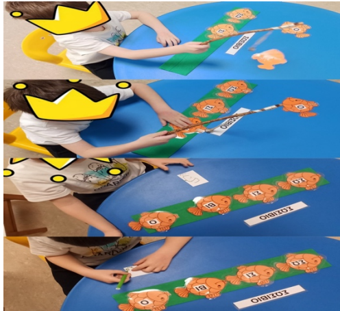
Εικόνα 1: Ψάρεμα Λέξης Σωσίβιο. γυαλιά πετσέτα,