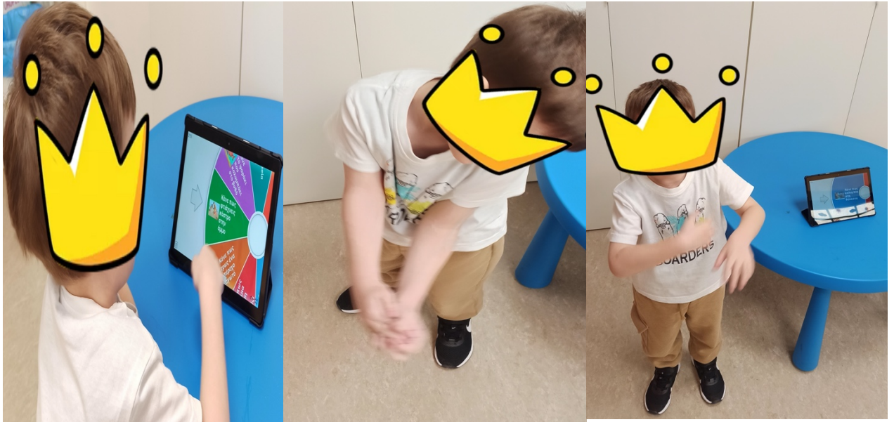
Εικόνα 1: Γυρίζει τον τροχό και δείχνει την κίνηση πως φτιάχνει πως κολυμπάει. κάστρο στην παραλία.