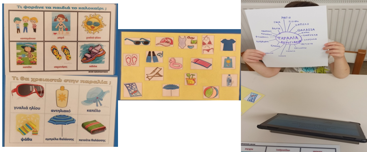
Εικόνα 4: Καρτέλες με αντικείμενα παραλίας και το ιστόγραμμα του νηπίου.

μπάλα, πέδιλα,σανίδα, κουβαδάκι, φτουαράκι, παγουρίνο, μπουκάλι, φρούτα, γυαλιά, μαγιό (Εικόνα 4).