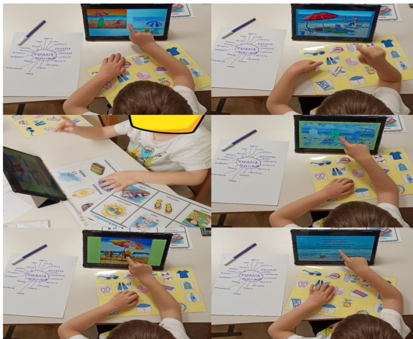
Εικόνα 2: Εντοπίζει, δείχνει και καταγράφει σε ιστόγραμμα. Εικόνα 3: Ανατρέχει αν δυσκολευτεί.

-Ζήτησε σε β' φάση από το νήπιο να καταγράψει σταδιακά σε ιστόγραμμα (με την βοήθεια της εκαιδευτικού) ποια αντικείμενα της παραλίας παρατήρησε στους πίνακες ζωγραφικής του βίντεο και τι άλλο θα έπαιρνε εκείνο μαζί του στην παραλία (Εικόνα 2). Δημιούργησε σε χαρτί A4 το ιστόγραμμα με θέμα: <<Παραλία/Ακρογιαλιά>> (εμπειριέχε: τι είδες και τι θα πάρεις μαζί σου). -Στην γ' φάση , σε περίπτωση που το νήπιο δυσκολευόταν, ανέτρεχε πίσω στο βίντεο ή κοιτούσε τις καρτέλες με τα αντικείμενα της παραλίας (Εικόνα 3).